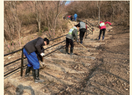
展望台まで続く階段の足場を整備