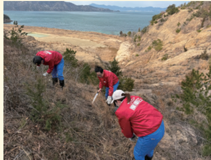
展望台の雑草を除去

*3 瀬戸内オリーブ基金：自動車リサイクル法制定の契機ともなった不法投棄事件が起こった香川県豊島の環境保全・再生活動に取り組むNPO法人 ( http://www.olive-foundation.org/ )