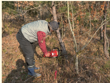
枯れ松をチェーンソーで伐倒する岡山大学・嶋一徹教授