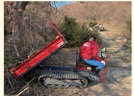
伐倒した枯れ松を切り分けて運び出す