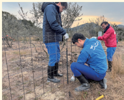
オリーブを守るためにイノシシ除けの柵を設置